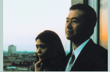
YOAKE – a chewing gum story