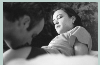
Von der Hingabe

Firn beschäftigt sich mit dem Druck des bäuerlichen "Generationserbes". Hannes bleibt am Hof, Bernd flüchtet in die Stadt, beide handeln nicht autonom, sondern fremdbestimmt. Bernd will eingreifen, wo er glaubt, dass Tradition sich über das persönliche Wohl eines Einzelnen stellt und vergisst dabei, dass er selbst Teil dieses Systems ist. (Sigmund Steiner)